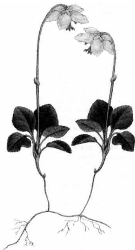
Ögonpyrola ( Moneses uniflora ) hittades i kanten av en blötmyr. Ur Lindman, C. A. M. 1922: Bilder ur Nordens Flora . Stockholm.

Många myr- och fuktmarksväxter är förvånansvärt ovanliga i Hebytrakten. Strandgyllen, strandklo och kärrspira ( Barbarea stricta , Lycopus europaeus , Pedicularis palustris ) sågs sålunda inte alls; sådana arter som taggstarr, storsileshår och rundsileshår ( Carex pauciflora , Drosera anglica , D. rotundifolia ) bara på några få lokaler var. Av mera krävande arter visade sig nickskära, slokstarr, granbräken och rosenpilört ( Bidens cernua , Carex pseudocyperus , Dryopteris cristata , Polygonum minus ) i diken intill den ett par kvadratkilometer stora torv-