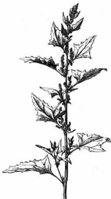
Bymålla ( Chenopodium urbicum ), mycket lik den vanliga svinmållan ( Chenopodium album ).

ga exemplaren av lönnmålla ( Chenopodium hybridum ) med hopp om att äntligen hitta den första platanmållan ( C. gigantospermum ) men vi hade ingen tur den här gången. Ett litet bestånd av en murreva såg ut att ha alldeles för stora blommor och visade sig även ha underjordiska utlöpare. Stace (1991) tar upp Cymbalaria pallida och C. hepaticifolia , vilka båda har de nämnda egenskaperna, men arten blev aldrig säkert fastställd. Även ett exemplar av en salvia ( Salvia sp. ) förblev obestämt. En stålig blomstertobak ( Nicotiana alata ) tronade högst upp på en jordhög med bl a grönmynta, skär kattost, nattskatta och hårgängel ( Mentha spicata , Malva neglecta , Galinsoga ciliata ).