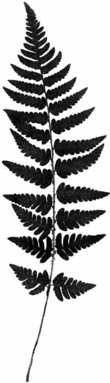
Granbräken ( Dryopteris cristata ) hittad vid Blommensberg.

ciliata ; vid Sturehov: Gulsippa Anemone ranunculoides och päron Pyrus communis ; vid Vällinge: Toppfrossört Scutellaria hastiflora , gulsippa Anemone ranunculoides , backruta Thalictrum simplex och päron Pyrus communis ; vid Bockholms-Sättra: Svedjenäva