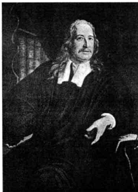
Olov Rudbeck d ä (1630-1702). Rudbeck hade en önskan om att avbilda alla världens växter. Han hade flera tusen träsnittsstockar färdiga då den stora branden i Uppsala bröt ut 1702 och förstörde de flesta av stockarna.