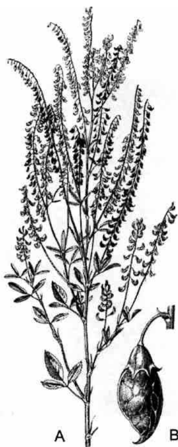
Rysk sötväppling ( Melilotus wolgicus ). A: Habitus. B: Balja.

Adventivexkursionen har alltid plats för improvisationer och ett tips om en konstig gulblommig och strävbladig växt förde oss till Rosenlundsparken. Utmed en husvägg,